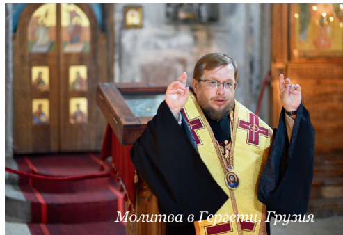
Молитва в Гергети, Грузия