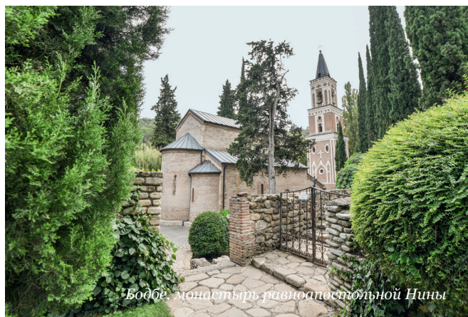
Бодбе, монастырь равноапостольной Нины

Отрывок из стихотворения Е. Евтушенко «Мой Тбилиси»