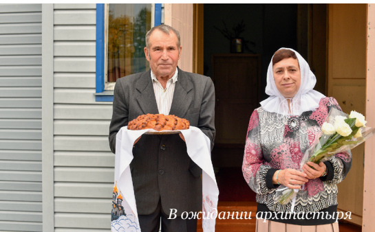
В ожидании архипастыря