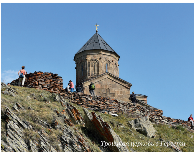
Трошкая церковь в Гергетии

В СЕНТЯБРЕ СВЯЩЕННОСЛУЖИТЕЛИ И СОТРУДНИКИ НАШЕЙ ЕПАРХИИ СОВЕРШИЛИ ПАЛОМНИЧЕСТВО В ГРУЗИЮ. В ТЕЧЕНИЕ НЕСКОЛЬКИХ ДНЕЙ ОНИ ПОСЕТИЛИ МНОЖЕСТВО СВЯТЫХ МЕСТ. ПРЕДЛАГАЕМ ВАШЕМУ ВНИМАНИЮ ВПЕЧАТЛЕНИЯ ОБ ЭТОЙ ПОЕЗДКЕ.