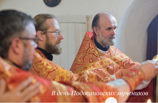
В день Подосиновских мучеников