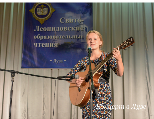
Концерт в Лузе