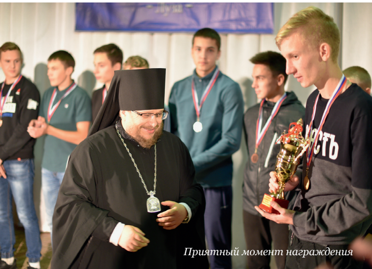
Приятный момент награждения