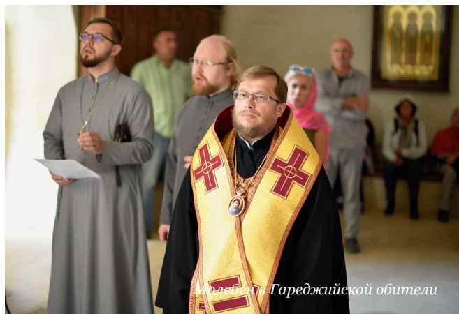
Молебен в Гареджийской обители

Богатейшая святынями, удивительно душевная и теплая, поразительно вкусная, завораживающая пейзажами Грузия... Эту страну я посетил впервые и сразу был сражен. Знаете, то чувство, когда от совокупности увиденного, услышанного у тебя широко открывается рот и нет слов. В Грузии восхищает все от природы и архитектуры до людей, с которыми Господь тебя сводит в этом паломничестве. Особенно меня впечатлила Лавра преподобного Давида Гареджийского. Долгая и тяжелая дорога. За окном постепенно менялся пейзаж: от цветущей зелени до настоящей пустыни. Сама Лавра находится на возвышенности в пустынном месте. Палящее солнце, пустыня, тишина,