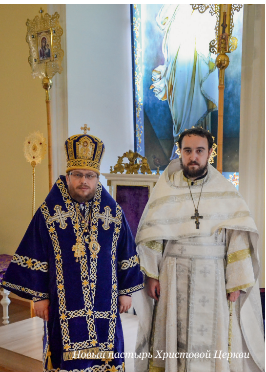
Новый пастырь Христовой Церкви